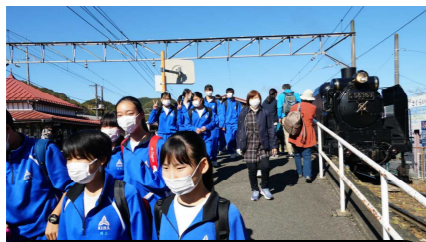
「SLの旅が初めて」という人も結構いました。長瀬で下車したところですが、いいお天気です。

2年生が長瀬体験学習に出かけました。熊谷～長瀬の往復はSLに乗車して、有隣倶楽部、宝登山神社、自然の博物館、長瀬岩畳に行きました。どこも紅葉が見頃で、すごく綺麗でした！お天気はまさに快晴！楽しい1日になりました。