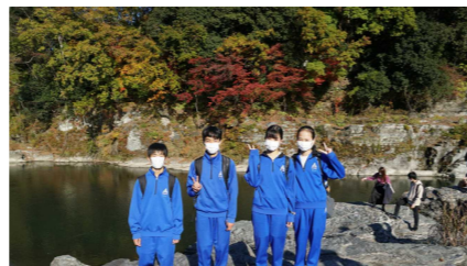
長瀬岩畳の上に立ちました。みんな元気いっぱい、川に落ちないか心配でした。