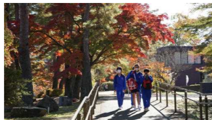
自然の博物館前の紅葉がすごく綺麗でした。